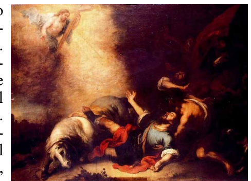
Bartolomé Estéban Murillo, Conversione di S. Paolo, Museo del Prado, Madrid

Paolo ha avuto questa esperienza del passaggio dalle tenebre alla luce, quando il Signore lo incontrò sulla strada di Damasco. È rimasto accecato. Cieco. La luce del Signore lo accecò. E poi, passati alcuni giorni, con il battesimo, riebbe la luce (cfr At 9,1-19). Lui ha avuto questa esperienza del passaggio dalle tenebre, nelle quali era, alla luce. È anche il nostro passaggio, che sacramentalmente abbiamo ricevuto nel Battesimo: per questo il Battesimo si chiamava, nei primi secoli,